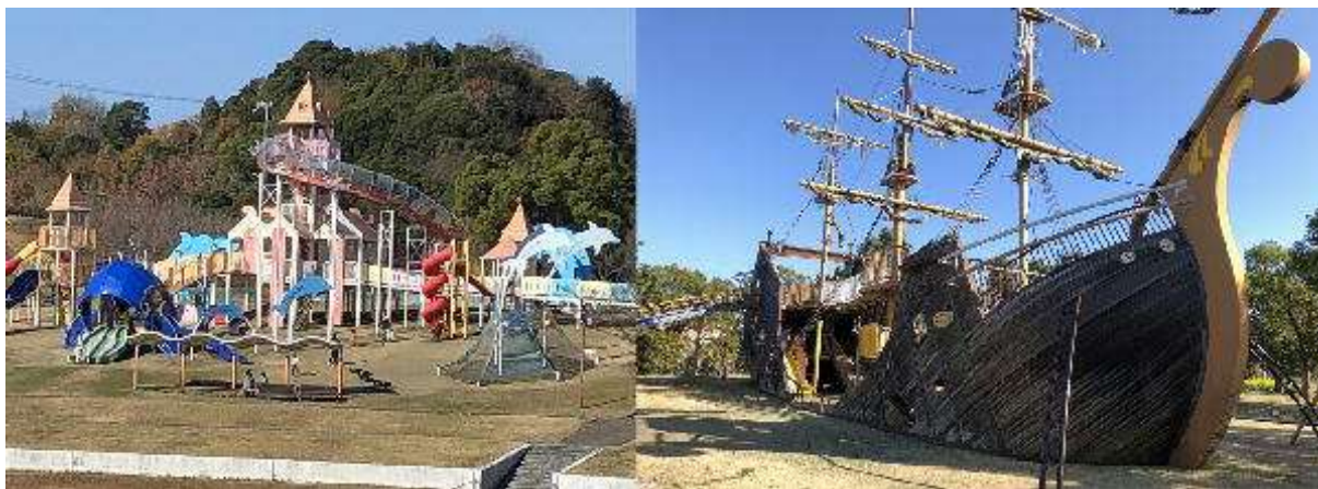
ゆめのみなと/ゆめのふね 新庄総合公園

主催 和歌山県オリエンテーリング協会 後援 田辺市 田辺市教育委員会 上富田町教育委員会 白浜町教育委員会 紀伊民報