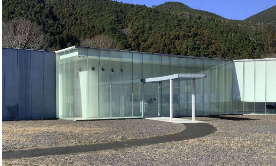
熊野古道なかへち美術館

大会当日、降雪など悪天候が予想されるときは、1月18日午前6時30分までに、 Japan-O-entrYの大会ページ 、および、 和歌山県オリエンテーリング協会公式X(旧twitter) でお知らせします。 公式ウェブサイトには、掲載いたしません。