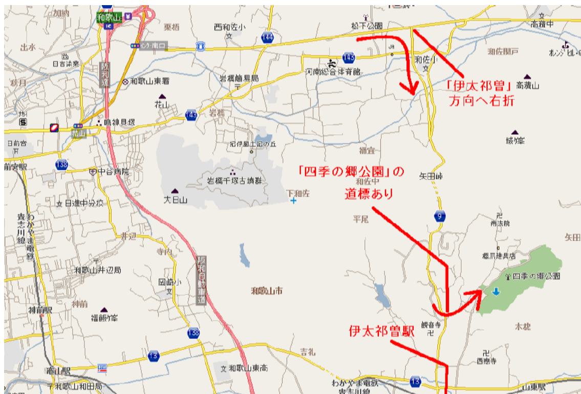
和歌山 IC ~ 四季の郷公園周辺図

公園入り口付近の駐車場が利用できます。次の周辺図を参考にお越してください。和歌山 IC 南口より、矢田峠経由のルートがお勧めです。